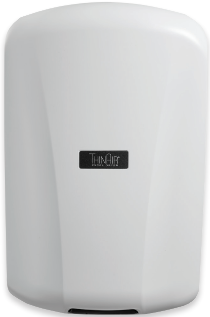
TA-ABS Polímero Blanco (ABS) Con Aditivo Antimicrobiano SanaFor™